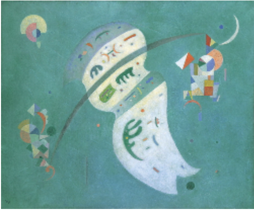
ヴァシリー・カンディンスキー Wassily KANDINSKY