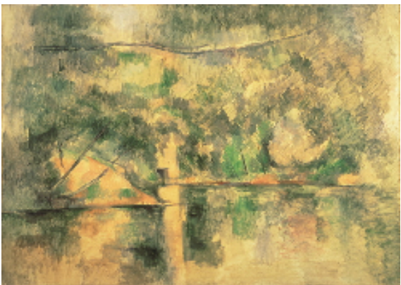
ポール・セザンヌ Paul CÉZANNE 《水の反映》 1888－90 年頃 油彩／画布 65.0 × 92.0cm