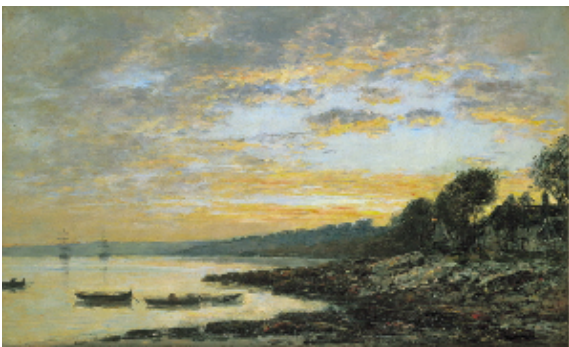
ウジェーヌ＝ルイ・ブーダン Eugène-Louis BOUDIN 《ブレスト、停泊地》 1872 年 油彩／画布 55.2 × 89.5 cm

絵画は、バルビゾン派を代表するコロー(1796－1875)や近代写実主義の巨匠クールベ(1819－77)、印象派の先駆的な画家といわれるブーダン(1824－98)、日本趣味でも知られる印象派のモネ(1840－1926)、ポスト印象派のセザンヌ(1839－1906)、象徴主義のルドン(1840－1916)、ナビ派のボナール(1867－1947)、キュビズムのロート(1858－1928)、抽象絵画への道を切り開いたカンディンスキー(1866－1944)などの作品を収蔵。彫刻は、彫刻の印象派というべきロツソ(1858－1928)をはじめ、アルプ(1886－1966)やザッキン(1890－1967)、マリーニ(1901－80)、グレコ(1913－95)などの作品を収蔵しています。版画は、アール・ヌーヴォーのミュシャ(1860－1939)をはじめ、グラッセ(1845－1917)やミロ(1893－1983)などの作品を収蔵しています。