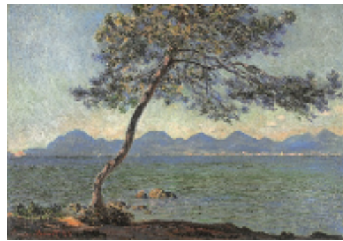
クロード・モネ Claude MONET 《アンティーブ岬》 1888 年 油彩／画布 65.0 × 92.0 cm