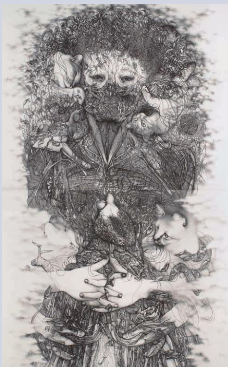
山田彩加《生命の繋がり》リトグラフ 2007年