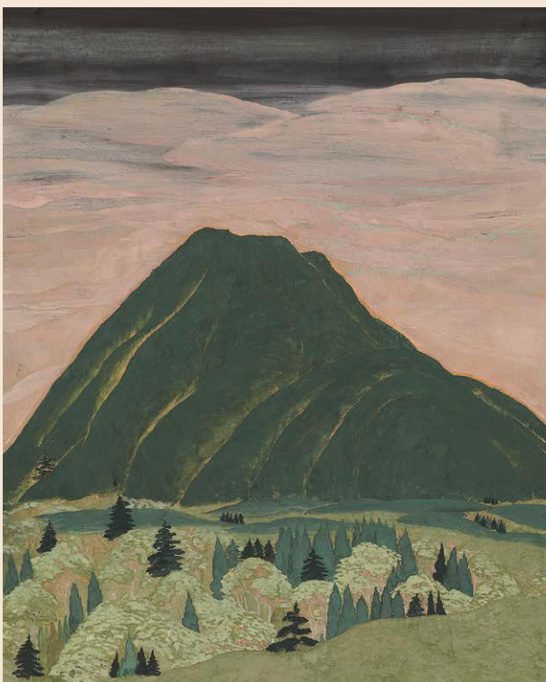
有元容子《黒姫》紙本着色 2003年