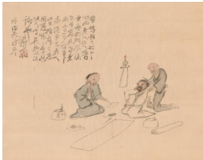
富岡鉄斎 《按摩図》 明治6（1873）年