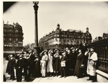
ウジェーヌ・アジェ 《日食、1911年》 1911年