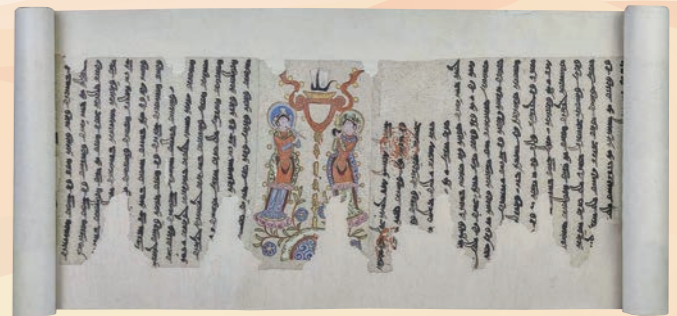
《マニ教ソグド語の手紙》11世紀初め/一級文物/トルファン博物館蔵

本展は、中国国内27か所の研究機関・博物館の所蔵する、シルクロードに関わる文物が一堂に会するまとと無い機会です。この夏は当館にて、シルクロードの世界を余すことなくご堪能ください!(若本 成美)