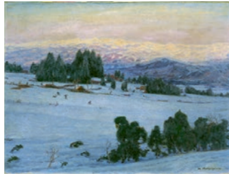
中川八郎《秘野残雪》1920(大正9)年

南館工事の関係により、館内でコレクションをご覧いただけない期間に当館の作品たちがまとめておでかけします!夏には、今治市玉川近代美術館と当館の同じ作家の両館作品が並びにぎやかな展示が、そして冬に生まれた中川八郎の誕生日を含む時期には、生まれ故郷にある五十崎風物博物館に中川の油彩画が並びます。ぜひ、いつもと違うコレクションに会いに東に南にとおでかけください! (喜安 嶺)