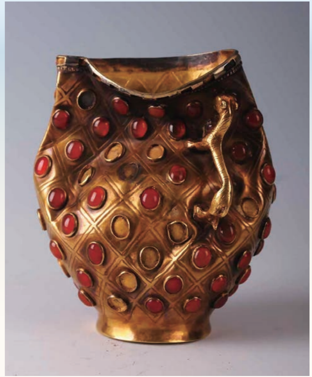
《瑪瑙象嵌杯》5-7世紀/一級文物/イリ州博物館蔵

した民族の影響を受け、異国風の服飾や音楽が流行しました。本章では、東洋と西洋の文化の融合によって生まれた、華やかな美術品をご紹介します。