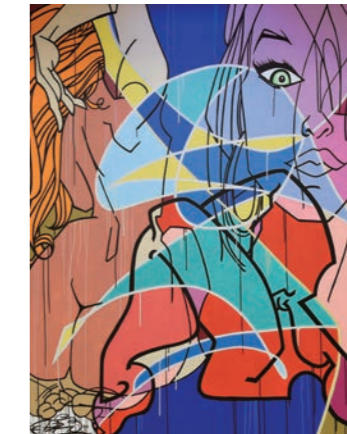
Pro 176 《Astro Anatomy》2011, Acrylic on canvas ©Artruss - Courtesy of the artist

本展では、グラフィティ時代の先駆者たちの作品から始まり、グラフィティアートとファインアートの橋渡しをしたヘリングやバスキア、ヨーロッパや日本にて活躍するストリートアーティストまで、バンクシー作品を含む約90点を紹介します。また作品に加え、ライターのアイディアが詰まった貴重なスケッチブック(通称ブラックブック)やマーカーペンなど、