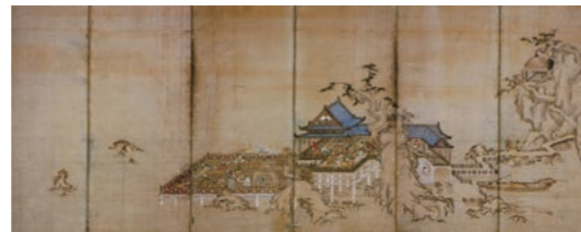
松本山雪《諸芸遊楽図屏風》江戸時代前期

R5年度は、145点の作品がコレクションに加わりました。内123点の国内外の主要作家の作品を多く含む写真作品は、山川コレクションとして一括寄贈受入したものです。年度末の展覧会で一堂にお披露目します。合わせて西予市(旧野村町)出身で京都を拠点に活動した松本仙拳(1880-1932)の文展・帝展入選作を含む14点(寄贈)、日尾八幡神社(松山市)の神官で、書家として名を馳せた三輪田米山(1821-1908)3点、初代松山藩御用絵師の松本山雪(?-1676)2点(各購入・寄贈)、富岡鉄斎(1836-1924)、中川八郎(1877-1922)、松浦巖暉(?-1912)各1点ずつ(いずれも寄贈)が収蔵されました。