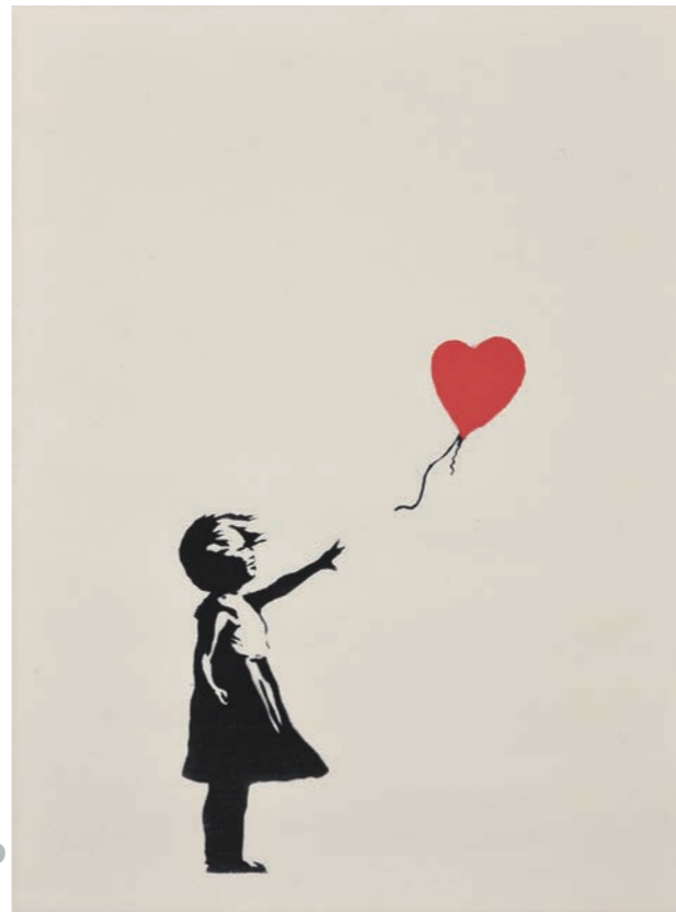
Banksy 《Girl with Balloon》2004, Serigraph on paper, Private Collection

テレビ愛媛開局55周年記念 バンクシー&ストリートアーティスト展 —ストリートアートの進化と革命— BANKSY & STREET ART (R)EVOLUTION 2024年9月7日(土)~11月17日(日)