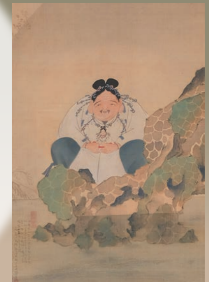
山田術居《大國主命・少彦名命像》(部分) 明治時代 松山市蔵