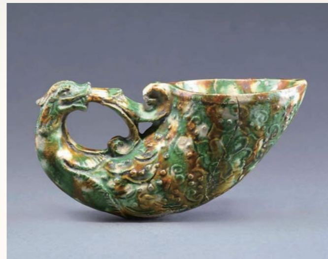
《鳳首杯》唐・8世紀/一級文物/陝西歴史博物館蔵