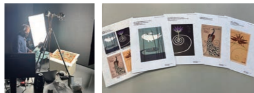
令和5年度実施事業より(作品撮影、触図制作)

令和2年4月に公布された「文化観光推進法」は、全国の博物館や美術館、社寺・城郭などの施設を中心に、文化についての理解を深める機会を拡大し、国内外からの観光客の来訪を促進させることで、地域文化の魅力発信・活性化に寄与することを目的とするものです。これに基づき、当館は令和5年9月に「文化観光拠点施設」に認定されました。開館30周年を迎える令和10年度までの5年間で、拠点施設としての機能向上にかかる様々な事業を計画的に実施していく予定です。(長井 健)