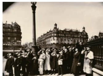
ウジェーヌ・アジェ《日食》1912年(山川コレクション)

松本山雪《諸芸遊楽図屏風》は、碁や書画等多様な遊楽や芸道に銘々興じる様が緻密に描かれており、完成度が高い作品です。ウジェーヌ・アジェ(1857-1927)は20世紀初頭の変わりゆくパリの街や人々の営みを記録し、「近代写真の父」と称されました。《日食》はレンズ越しに太陽を観察する人々をとらえた、どこかユーモアのある作品です。(杉山 はるか)