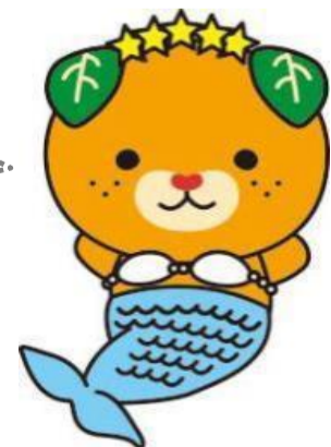
愛媛県イメージアップキャラクター「みきゃん」

駐車場は、県庁西駐車場を2時間まで利用することができますが、駐車台数に限りがありますので、できるだけ公共交通機関等のご利用をお願いします。